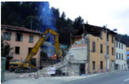
Le renouvellement urbain, ce sont des logements neufs qui remplacent l'habitat ancien. Ici le Palladio, à l'entrée de la commune.

Depuis, Saint-André de la Roche a entrepris une restructuration de l'habitat ancien et le transfert des activités industrielles vers la zone d'activités La Vallière. Le Domaine de la Roche, avec ses commerces et services, a vu le jour. Puis les Allées Victoria, en périphérie de la ville, et bientôt le Quai 101 et la Villa Constance seront livrés. Cette évolution, anticipée, préparée et maîtrisée mérite toutefois d'être mise en perspective et expliquée.