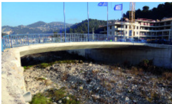
L'assèchement rapide de la Banquière dans certaines sections s'explique par un déficit pluviométrique en août, septembre et octobre.

Après réhumidification des sols et des roches, une partie des eaux précipitées s'est infiltrée en direction des aquifères sans cependant provoquer la remontée du niveau de la nappe alluviale de la Banquière à des cotes permettant un écoulement de surface conséquent et durable dans les sections du cours d'eau présentant des épaisseurs d'alluvions importantes”.