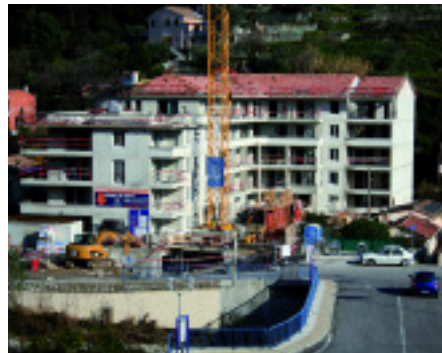
La Villa Constance, 55 logements sur la rive gauche de la Banquière. La moitié des acquéreurs sont Saint-Andréens.